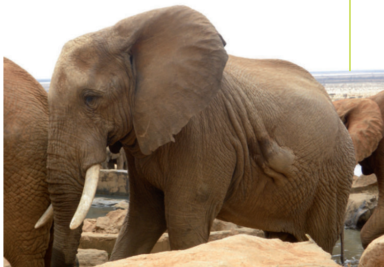
Éléphant blessé par une flèche

Le monde bouge enfin et cette force positive ascendante finira on l'espère par retourner la situation. Le sort des éléphants d'Afrique est entre nos mains à tous. ■