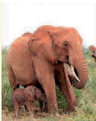
Inca et sa maman Icholta

en ont profité pour observer la petite d'Icholta, Inca . Elle pétait le feu et semblait super à l'aise au côté de son meilleur ami Safi, le fils de Sweet Sally, né en brousse. Le groupe était entouré par plusieurs troupes d'éléphants sauvages, estimés à environ 200 individus.