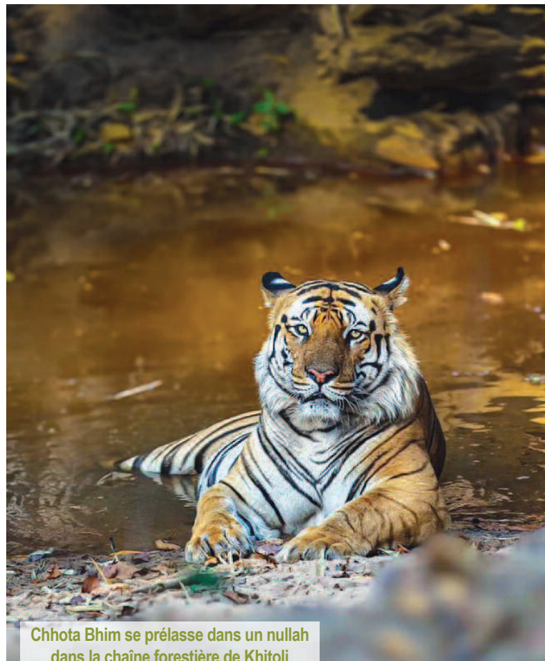
Chhota Bhim se prélassa dans un nullah dans la chaîne forestière de Khitoli