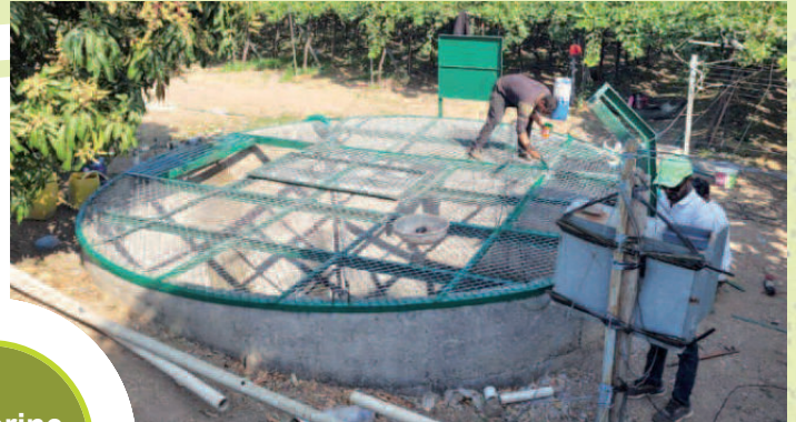
Puits couvert à Nimgaon Sawa