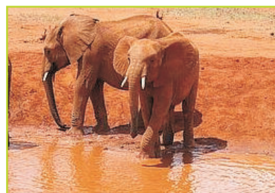
Tassia et Taveta

impliqués dans un violent règlement de compte. Les autres ne les voyant pas venir rebroussèrent chemin à leur recherche. Voyant que ça chauffait, ils firent diversion en initiant un jeu de cache-cache pour réduire la tension entre les deux mâles.